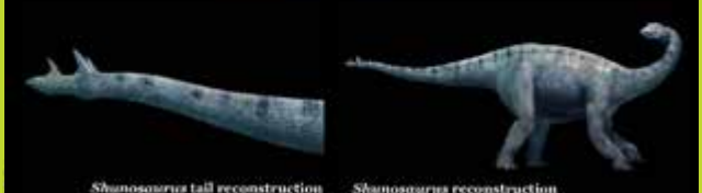
© Untold Secrets of Planet Earth: Dire Dragons