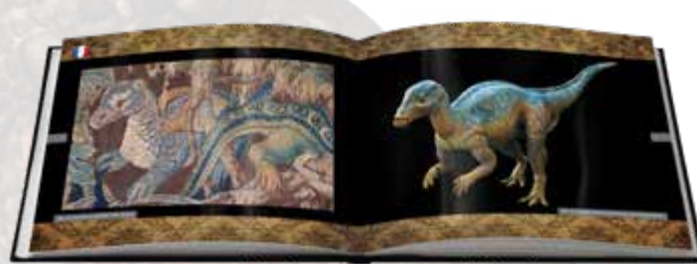
© Untold Secrets of Planet Earth: Dire Dragons

Il drago turchese, mostrato a sinistra e proveniente dalla cultura di Hongshan, in Cina, ha probabilmente più di 4000 anni. I cinesi raffiguravano molti tipi di draghi. Sorprendentemente, il loro aspetto è simile a varie ricostruzioni di dinosauri. Il drago turchese è diverso dagli animali oggi conosciuti, ma presenta interessanti affinità con il centrosaurus unicorno.