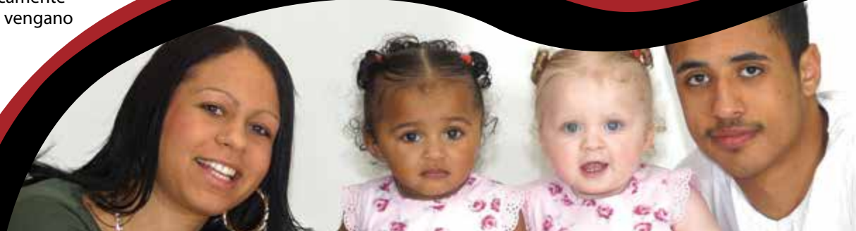
Foto delle gemelle