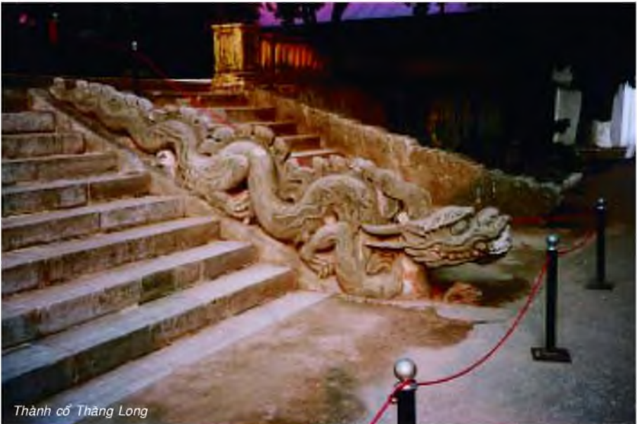
Thành cổ Thăng Long

“Rồng uốn khúc, hổ ngồi”: 藏龙卧虎 : (cáng long wo hu): Long bàn, hổ cứ : có nghĩa là chỗ đất hiểm yếu hay