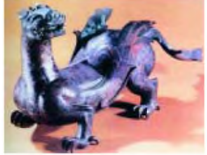
Thú (thần) đồng hai cánh.