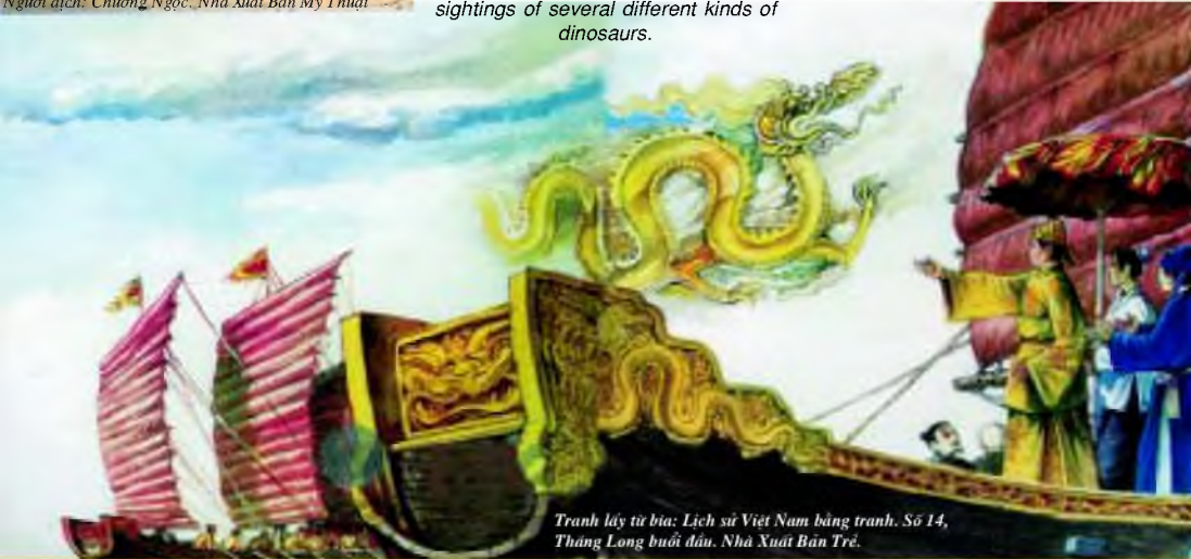
Tranh lấy từ bia: Lịch sử Việt Nam bằng tranh. Số 14, Thùng Long buổi đầu. Nhà Xuất Bản Trẻ.