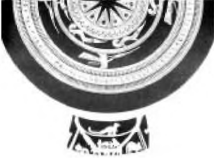
Những hình ảnh sơ khai của rồng Việt nam trên trống đồng Đông Sơn