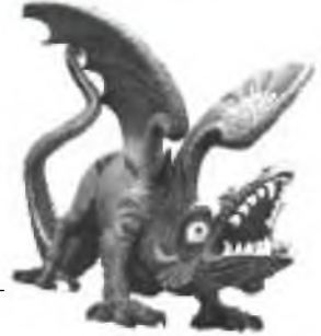
Rồng Châu âu

Rồng và quỷ (Tranh minh họa từ bản viết tay Shah Nameh, 1486) The 'dragon' depicted in this picture (left) from Iran some 500 years ago bears an uncanny resemblance to the often depicted dragon that Ly Thai To reportedly saw in North Vietnam (below) about 1,000 years ago. It is very likely that this kind of animal as well as the flying reptile type shown on the back cover both existed in Vietnam and many other places. It's unknown if this animal could fly, and the Ly Thai To dragon is possibly a mixing of various sightings of several different kinds of dinosaurs.